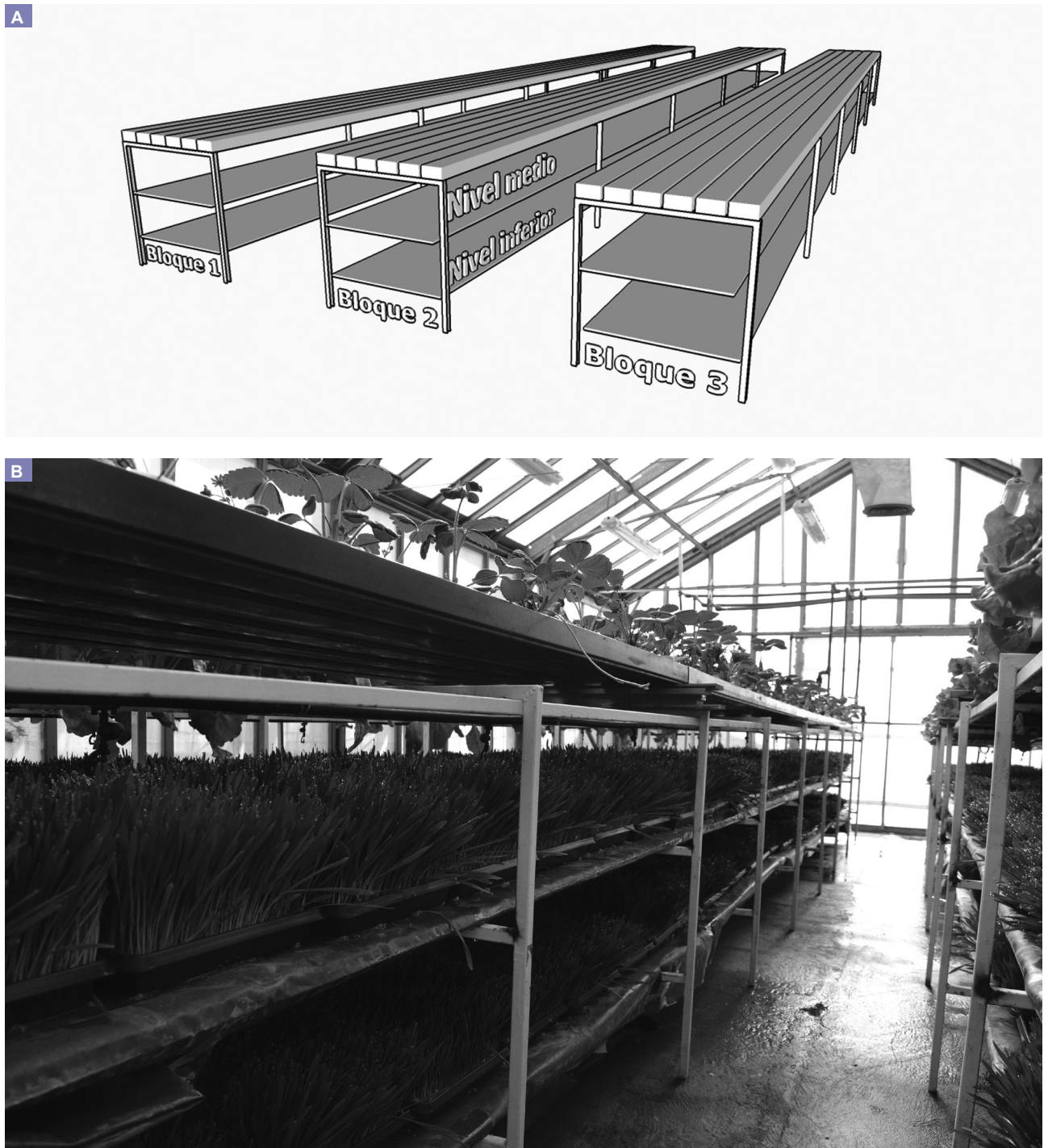
Figura 1. A) Esquema de la disposición de las bandejas para la producción de forraje verde hidropónico (FVH) en un invernadero de Río Gallegos, Santa Cruz. En el nivel superior de la mesada se encuentra emplazado un cultivo de lechuga, como cultivo principal, mientras que el FVH se evaluó en los niveles medio e inferior. B) Foto de una de las mesadas donde se observan las bandejas de forraje en el nivel medio e inferior de esta.

en los niveles superior, medio e inferior fue medida con un medidor marca Apogee Model MQ-301, durante 4 días (dos soleados y dos nublados) siempre a las 12:30 h del mediodía para conseguir el máximo ángulo solar.